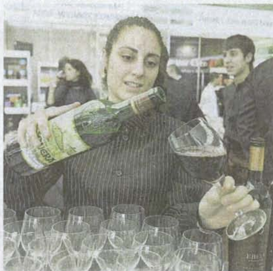
Una de las estudiantes del Colegio Alcazarén sirve un Tinto.

Precisamente, uno de los principales méritos que reúne Valladolid