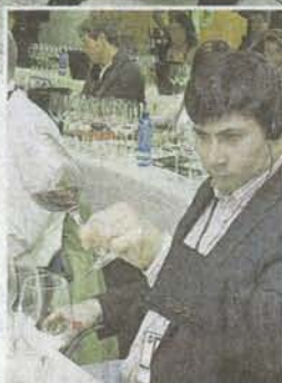
Cata de la Ribera del Duero.

ros: 30 alumnos de Cocina y Turismo del IES Diego de Praves y 14 estudiantes del Colegio Alcazarén, para que todo rodase como la seda a la hora de atender al millar de congresistas. Entre los que tuvieron el privilegio de probar los pinchos y vinos de Valladolid se encontraban dos grandes de la cocina vasca como son José Mari Arzak y Martín Berasategui, quienes no se perdieron «ese lechazo tan estupendo».