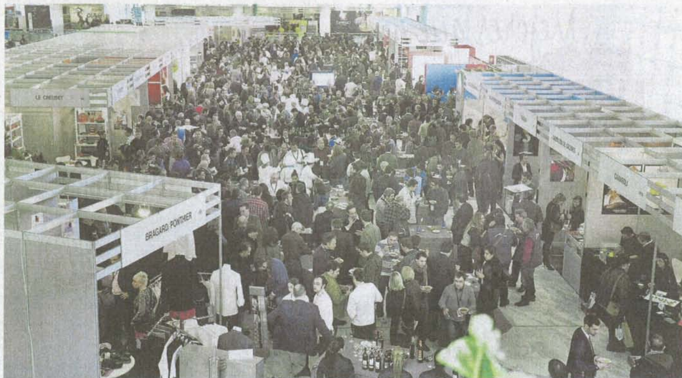
Los congresistas llenaron ayer la sala polivalente del Palacio de Congresos durante el almuerzo ofrecido por Valladolid en Madrid Fusión.