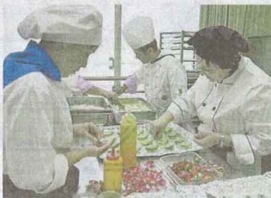
Una alumna y una profesora del IES Diego de Praves preparan pinchos en las cocinas del Palacio de Congresos de Madrid.